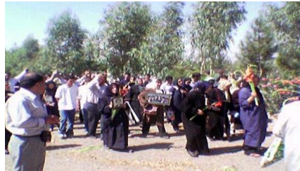
مراسم شکوهمند یادمان کشتار زندانیان سیاسی تابستان ۶۷ در گلزار خاوران شهریور ۱۳۸۴

کشتار سراسری زندانیان سیاسی در تابستان و شهریور ۶۷ لکه ننگی در تاریخ معاصر ایران و در تاریخ بشریت است. رژیم سرمایه داری جمهوری اسلامی ایران به نام الله و به نام دین اسلام و برای حفظ موقعیت طبقاتی و تثبیت حاکمیت سرمایه داری منافع پس مانده ترین قشر سنتی جامعه و ایجاد رعب و وحشت در کشور، عفریت مرگ را بر بالای سر زندانیان سیاسی به پرواز درآورد و با بیرحمی و شقاوت غیر قابل توصیف هزاران انسان پر امید را در بیدادگاه های چند دقیقه ای محاکمه و به جوخه تیرباران سپرد و یا به دار آویخت. رژیم جمهوری اسلامی چنان بیرحمانه و جنون آمیز به زندانیان در بند یورش برد و چنان قتل عامی به راه انداخت که فقط با رژیم های فاشیستی نظیر هیتلر و موسولینی و فرانکو قابل مقایسه است. در اعتراض به این کشتار بربرمنشانه، دهم شهریور ماه از سوی خانواده های قربانیان این فاجعه، سال روز کشتار همگانی اعلام گردید و هر ساله در چنین روزی مادران و پدران داغ دیده، فرزندان، دوستان و یاران جانباختگان در گلزار خاوران گرد می آیند و با برنامه های متنوع یاد این عزیزان را گرامی می دارند. جنبش اعتراضی خانواده جانباختگان تابستان ۶۷ در حال شکل گیری است و امسال نیز این عزیزان می کوشند همراه با سایر مردم آزادیخواه در خاوران گرد آیند و یاد فرزندان خود را گرامی بدارند.