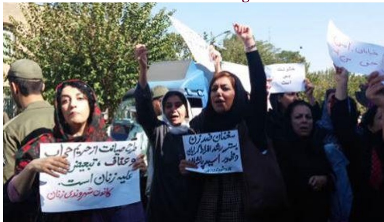
تصویری از اعتراض مردم علیه اسید پاشی در تهران