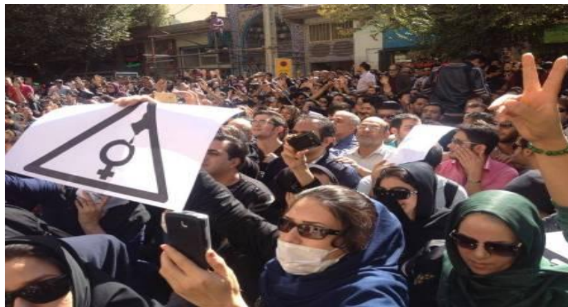
تصویری از اعتراض مردم خشمگین علیه اسید پاشی در اصفهان