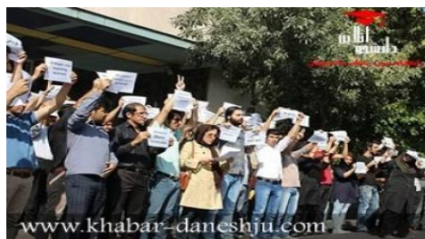
تصویری همبستگی دانشجویان دانشگاه تهران با کوبانی

همبستگی سراسری همه اپوزیسیون انقلابی و ترقی خواه و همه مردم صلحدوست و آزاده جهان با کوبانی نشان میدهد که کوبانی فقط مربوط به کردها و یک امر خاص کردی نیست. کوبانی مسئله همه آزادیخواهان نیست که بر علیه سلطه طلبی امپریالیست آمریکا و "دکترین خاورمیانه جدید" یعنی تجزیه کشورها و قتل و خونریزی و غارت منابع طبیعی خلقهای منطقه می رزمند و از آزادی، استقلال و عدالت اجتماعی دفاع میکنند. آن بخش از کردهایی که به ننگ سازش با وحوش داعش و امپریالیست جنایتکار آمریکا و رژیم صهیونیستی اسرائیل تن داده و کاسه گدایی خودمختاری و استقلال در دست گرفته اند لکه ننگی در تاریخ مبارزات خلقهای منطقه اند و باید به افشای آنها دست زد. دارودسته خودفروش مسعود بارزانی از این قماشند. اتحادیههای کارگری ایران، کارگران هفت تپه، فلزکار مکانیک، اتوبوس رانی شرکت واحد و دانشجویان دانشگاههای مختلف ایران همبستگی خود را با صدور بیانیه های سیاسی و تجمعات متنوع ابراز داشته اند