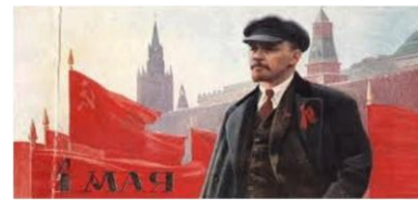
کارگران جهان بگانه شوید!

سخنرانی درمورد اوضاع کنونی ایران و منطقه