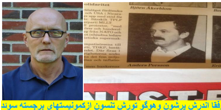
رفقا اندرش پرشون و هوگو تورش تنسون از کمونیستهای برجسته سوئد

با کمال تأسف مطلع شدیم که دوتن از رفقای رهبری سابق حزب کمونیست سوئد (ک پ اس)، رفقا اندرش پرشون، دبیر اول و بنیان گذار حزب و هوگو تورش تنسون عضو کمیته مرکزی و مسئول هئیت تحریریه "نشریه کمونیست" در نوامبر و دسامبر ۲۰۱۵ بدرود حیات گفتند. رفیق اندرش پرشون در آستانه جشن هفتادمین سالروزش بود که قلبش در اثر سکت قلبی از حرکت باز ایستاد و رفیق هوگو تورش تنسون نیز به تازه گی شصت سالگی اش را جشن گرفته بود که متأسفانه بیماری سرطان مجال به ادامه حیاتش نداد. حزب کمونیست سوئد (ک پ اس) در سال ۱۹۸۰ در وحدت با چند سازمان و گروه م ل احیا گردید و تا پایان ۱۹۹۵ میلادی به فعالیتش ادامه داد.