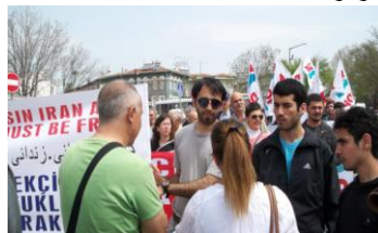
تصویری از تظاهرات اول ماه مه در ترکیه. پناهندگان ایرانی مقیم ترکیه با حمل پلاکاردهائی در دفاع از زندانیان سیاسی و محکومیت جمهوری اسلامی در این تظاهرات شرکت کردند.